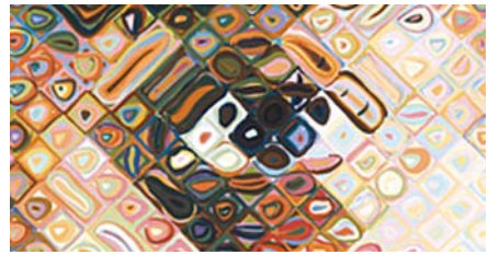
részlet a Lyle című képből

1970-től Európa számos városában is kiállított. Fő profilja az emberi arc életnagyságúnál nagyobb léptékű ábrázolása volt. Alkotásai felkeltették a művészvilág figyelmét. Az egyszerű portréit kezdte a vizuális érzékelés különböző formáival megoldani. Absztrakt részletek hálózatából építette fel képeit, amelyek a néző szemében állnak össze valódi képpé. Munkája során sok-sok mértani egységge bontotta az emberi arcot. Munkássága radikálisan megváltoztatta a modern portréfestészetet.